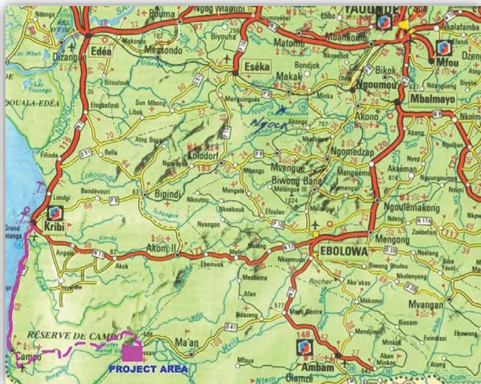
Figure 1: Route d'accès au site de l'aménagement hydroélectrique de Memve'ele

Il est accessible via la Nationale N°2 (Yaoundé - Ebolowa - Meyo centre) et la Départementale N°41 (Meyo centre - Ma'an - Nyabissan).