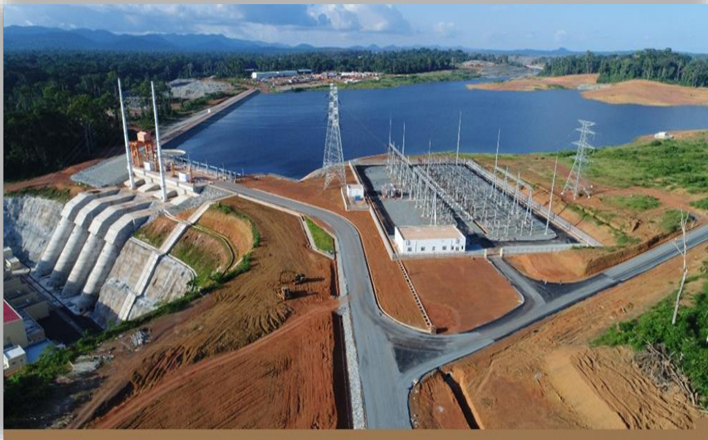
Figure 3: Vue de quelques installations du barrage hydroélectrique de Memve'ele