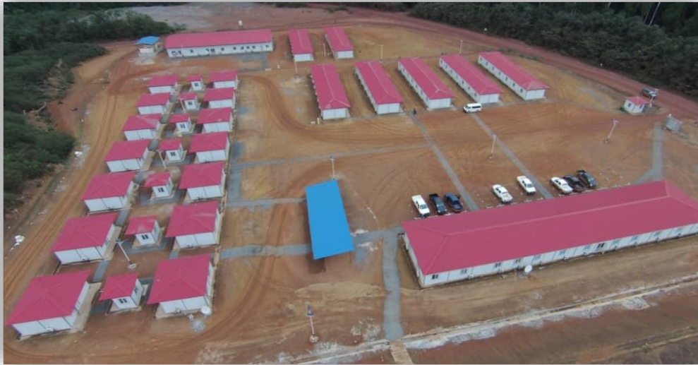
Figure 2: Vue de la cité d'habitation des personnels d'exploitation et de maintenance